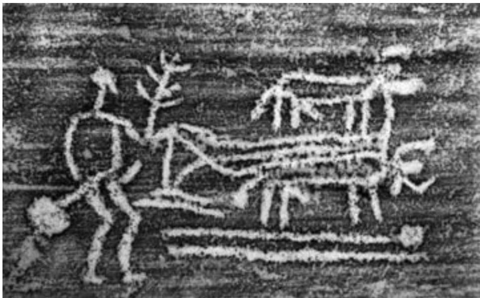
1. Pløjescene fra Litsleby Utmark, Tanum.

skålgrube. Skålgruber er en rund fordybning i stenfladen og opfattes almindeligvis som frugtbarhedstegn, hvilket jeg vender tilbage til.