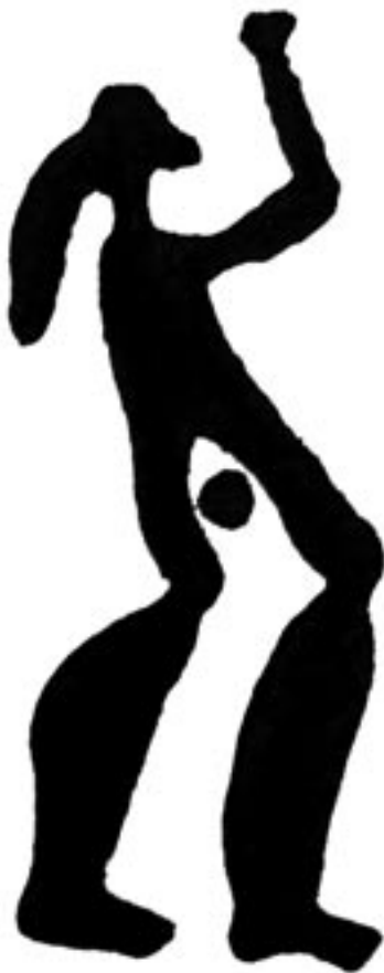
3. Kvinde, hvis køn er markeret med skålgrube, Fossum, Tanum.

betyder skibsvognen, er blevet kørt over jorden for at bringe den grøde og grokraft. Det cykliske, hvor afslutningen samtidig er en ny begyndelse, har gennemsyret bronzealderens livsopfattelse. Tilværelsen har på alle planer været bestemt af den evige gentagelse - liv, død og genfødsel, og skibet er knyttet både til afslutningen og begyndelsen af cyklen, uanset om det er døgnets, årets eller menneskelivets cyklus, der drejer sig om. I forbindelse med den nye begyndelse får skibet en symbolsk betydning som det moderskød, der skal føde det nye 1 . Det er velkendt, at skibe ofte har pigenaavne, selvom det ikke er konsekvent. Det forholder sig nemlig sådan, at skibet også kan opfattes