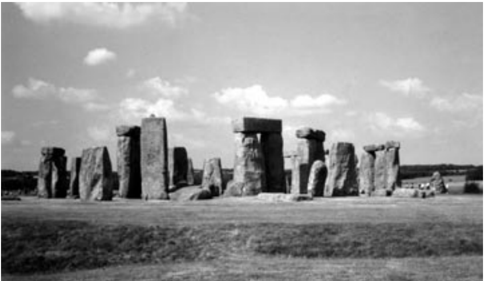
6. Stonehenge. (Berit Johnsen)

Det anlæg, man kan se i dag stammer fra ca. 1600 f.Kr., altså fra bronzealderen. I Stonehenge kan man finde en lang række af de symboler, man i lille format finder blandt helleristningerne. Et vigtigt træk ved arkitekturen er de to koncentriske cirkler, der