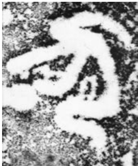
7. "Den knælende kvinde". Vitlycke, Tanum. (Bruun Jørgensen)

omslutter en dobbelt hestesko eller U-formet stensætning, hvis åbning vender mod nordøst.